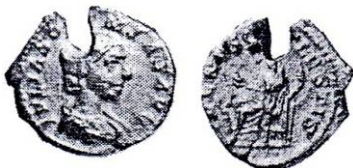
Fig. 1. Monedă emisă de Elagabalus pentru Iulia Soemias, cu tăietură ( apud Ioniță et alii 2004, p. 65, nr. 13)

arată că dacă nu toate, cel puțin cinci exemplare au fost găsite în cu totul altă poziție stratigrafică decât cea în care ar fi trebuit să se afle în mod natural.