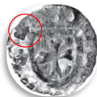
Fig. 5. Monedă cu urme de „exfoliere” a materialului de suprafață; posibil fouillée (apud Samuel, Žažová 2012)