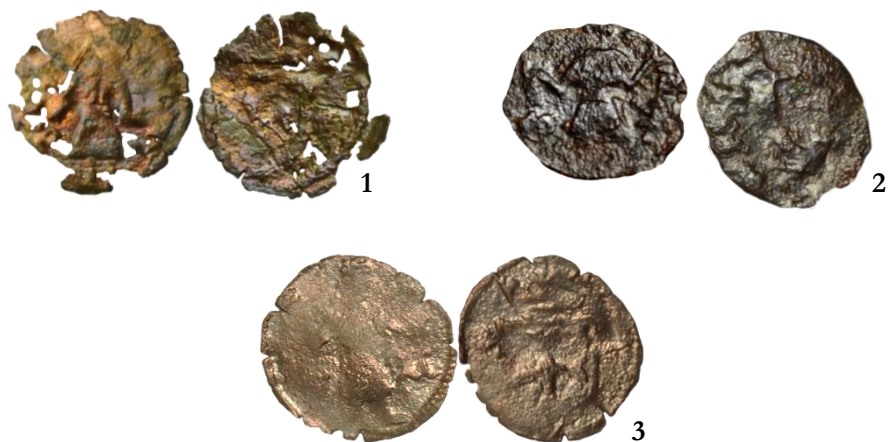
Fig. 1-3. Monede subdivizionare de tip Dan al II-lea/Nicolae Redwitz descoperite arheologic în situl Mănăstirea Bizere (județul Arad, România)