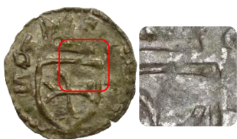
Fig. 4. Monedă cu urme de argintare observate în urma analizării microscopice