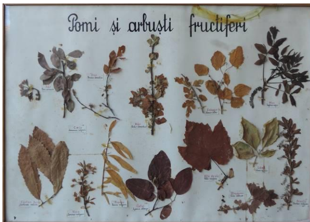
Fig. 4. Planșă-ierbar din 1957, alcătuită de Al. Borza