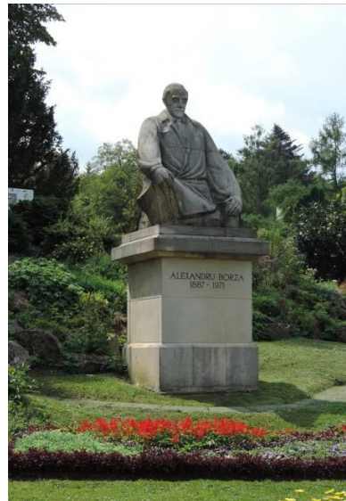
Fig. 8. Statuia profesorului Al. Borza din Grădina Botanică din Cluj-Napoca