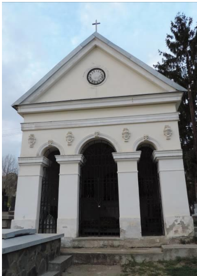
Fig. 7. Capela funerară a familiilor Negruțiu și Borza de la Blaj