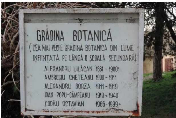
Fig. 2. Panoul (degradat) de la intrarea în grădina botanică din Blaj