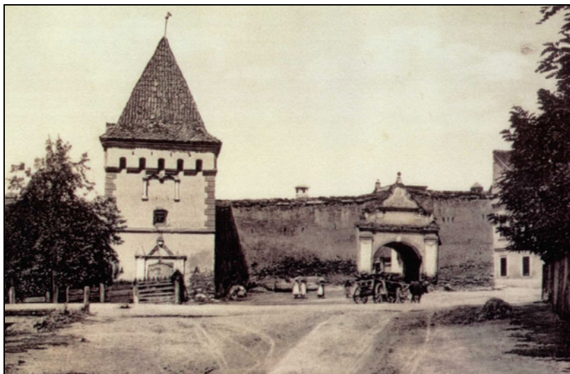
Fig. 3 Poarta de lângă Turnul Fierarilor văzută dinspre Str. Cloșca

A fost construită relativ târziu față de restul sistemului defensiv al orașului, la sfârșitul sec. al XVIII – începutul sec. al XIX și a avut o perioadă de utilizare destul de scurtă, fiind dărâmată în jurul anului 1896 pentru crearea spațiului necesar modernizării căii de acces în zona centrală. Era încastrată în zidul de incintă din partea de N-E a Turnului Fierarilor. Poarta este foarte bine cunoscută din numeroase imagini de epocă (fotografii sau tablouri), pe care se remarcă, îndeosebi, impresionantele frontoane decorate în stil baroc (fig. 3-4).