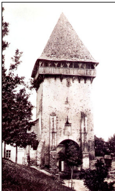
Fig. 2 Turnul Zeckesch văzut dinspre acuala str. Șt. O. Iosif

Turnul Porții Zeckesch ridicat în aceeași perioadă cu Turnul Forkesch (1494-1534, mai precis în primul deceniu al sec. al XVI-lea) era prevăzut cu galerie de strajă din lemn, cu guri de aruncare și cu contraforturi exterioare. Acestea aveau lăcașuri pentru grilajele masive de lemn, care, prin culisare pe verticală, permiteau închiderea porții. Turnul a fost demolat la sfârșitul sec. al XIX-lea (1895) pentru fluidizarea circulației în zona respectivă ( fig. 2 ).