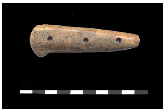
Fig. 7. Plăsea de cuțit descoperită pe str. I. G. Duca-Mediaș