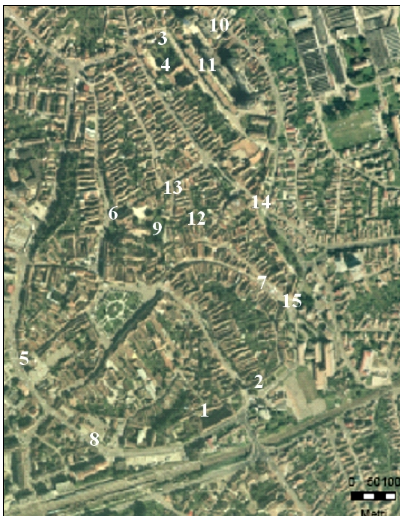
Fig. 5. Harta punctelor de interes arheologic din zona vechii fortificații medievale a Mediașului