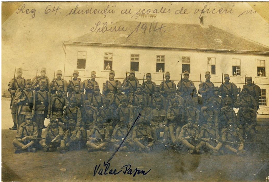
Fig. 1. „Școala de of. [ițeri] Sibiu 1914”