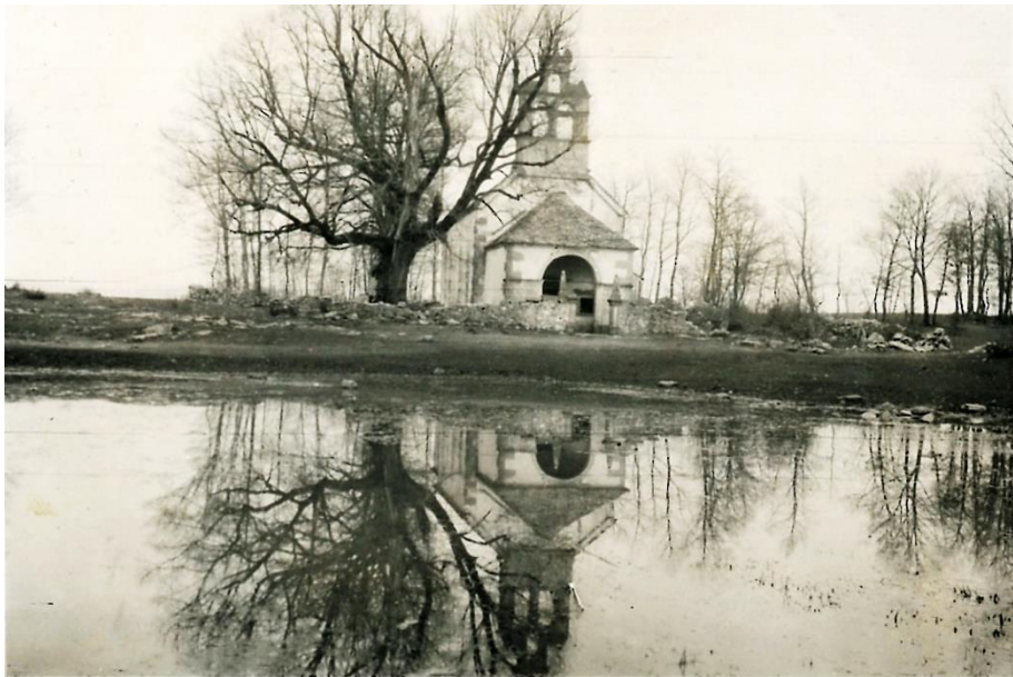
Fig. 4. „Părăsită”