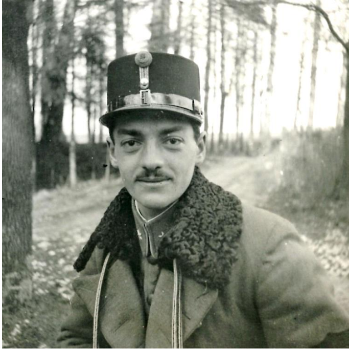
Fig. 3. „În Freudenthal – Silezia 1916”