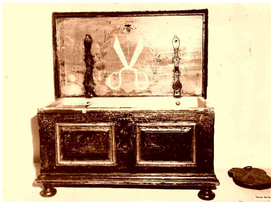
Fig. 4. Lada și tabla breslei croitorilor la începutul anilor '60

Numeroase artefacte cu valoare documentară deosebită pentru trecutul orașului au intrat în colecția de Istorie-etnografie, iar un partener important a fost Parohia Evanghelică, care, cu acordul Consistoriului Superior, a donat muzeului bunuri, unele cu o valoare excepțională, amintind în special sabia de călău a orașului, un artefact care, în foarte scurt timp, a devenit de referință în expoziția de bază. În afară de această piesă, au fost donate și altele, cu funcțiuni militare în trecut, precum o archebuză și o sabie de cavalerie. La acestea se adaugă bunuri care contribuiau la o mai bună ilustrare a istoriei economice a orașului, amintind, în special, tabla și lada breslei croitorilor, prima datând din 1717, iar a doua din 1786. Alte bunuri, de data aceasta monumente litice, s-au adăugat celor deja existente, conturându-se posibilitatea constituirii unui lapidariu. Este vorba despre o coloană votivă romană din marmură, un altar, o lespede cu un blazon și o stemă a Sebeșului, datând din anul 1765, care provenea de pe fațada principală a sediului Magistratului orașului, edificiu demolat în anul 1880.