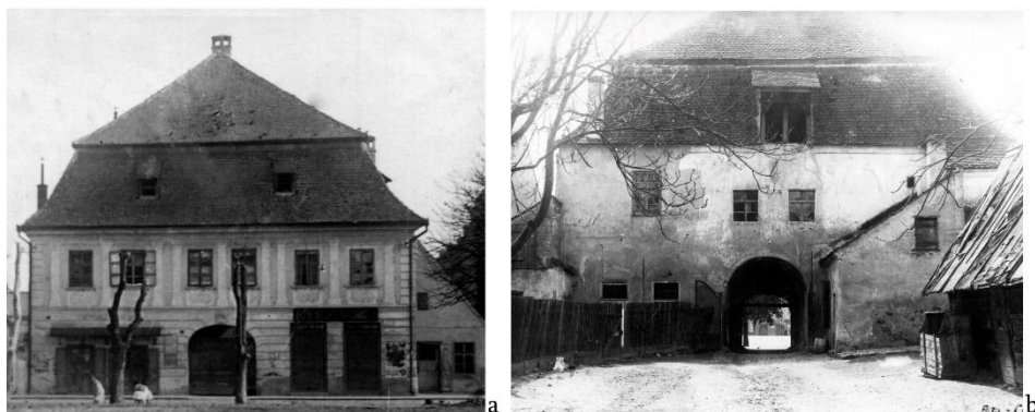
Fig. 2. Casa Zápolya – fațadele de sud (a) și de nord (b) – în perioada interbelică (sursa: MMIRS – Fototeca)

Încăperile de la parter nu puteau fi folosite de muzeu sau de Secția Culturală, deoarece acolo se afla locuința îngrijitoarei. Un inconvenient major îl reprezenta și prezența în curtea imobilului a unui depozit de sare, care, pe lângă disconfortul creat, afecta și monumentul, camioanele intrând și ieșind din incintă prin gangul carosabil 67 .