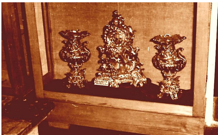
Fig. 5. Ceas și vase din alamă aurită – colecția Răchițeanu la începutul anilor '60

Colecțiile au crescut și prin artefacte descoperite în urma cercetărilor de teren, în special a celor arheologice realizate în parteneriat cu muzeele din Alba Iulia și Sibiu la punctele: Podul Pripocului (Sebeș), Dealul Șipotelor (Răhău), Arsuri (Răhău) și Budurăul Ciobănelului (Răhău) 167 .